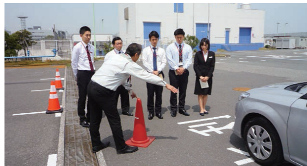
毎年、新入社員を対象に外部講師を招いて安全運転講習を行っています。また、事故惹起者に対しても社外で講習を実施し、再発防止に取り組んでいます。