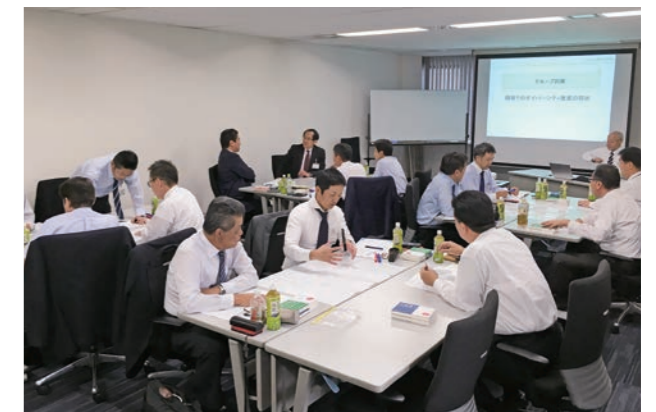
ダイバーシティ・マネジメント研修の様子

社員の属性や価値観、働き方は多様化しており、生産年齢人口が減少する中では、多様性(ダイバーシティ)のある人材のマネジメントが必要不可欠です。三菱石油(株)では、これまで役員および部長職以上の経営層を対象とした「ダイバーシティ・マネジメントセミナー」、本社と羽田支社の管理監督者を対象とした「ダイバーシティ・マネジメント研修」を実施しました。2019年度は、東京・大阪・福岡の3エリアで計73名の管理監督者を対象に研修を実施し、ダイバーシティの重要性やその推進が妨げられる要因について理解を深めました。誰もが活躍できる組織風土を醸成するため、今後も積極的に取り組みを行っていきます。