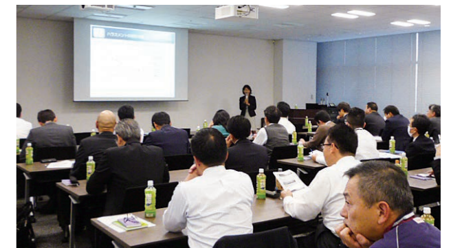
ハラスメント研修会の様子

すべての社員がハラスメントを正しく理解し、働きやすい職場づくりを実現するため、管理監督者を対象にした研修会の実施や、e-ラーニングを活用したハラスメント防止教育を行っています。2020年度は、e-ラーニングの導入をグループ各社に拡大し、グループ全体でのハラスメント防止教育に取り組めます。