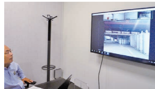
リモート監査の様子