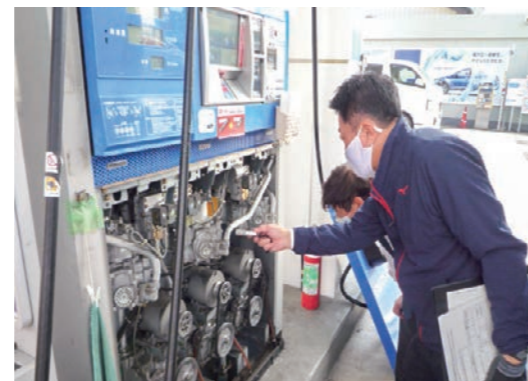
サービスステーションの現場確認